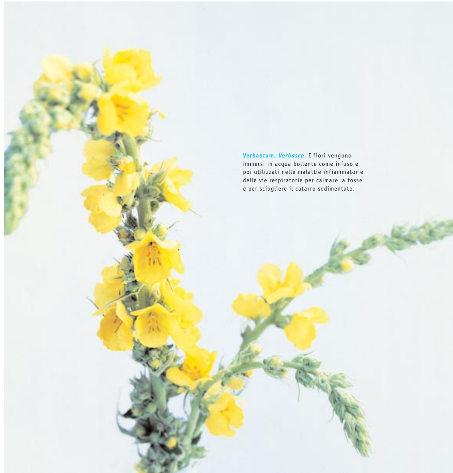
Verbascum, Verbasco. I fiori vengono immersi in acqua bollente come infuso e poi utilizzati nelle malattie infiammatorie delle vie respiratorie per calmare la tosse e per sciogliere il catarro sedimentato.

Con la malattia, l'uomo ha occasione di riconoscere, capire e, con l'aiuto della terapia, riportare in salute l'equilibrio turbato in cui corpo e anima sono caduti. Le malattie croniche possono offrirgli la possibilità di imparare nuovi stili di vita e di maturare nella personalità. I medici antroposofi sostengono il paziente proprio in questo compito. Essi fortificano il suo senso di responsabilità individuale, riconoscono la sua emancipazione, promuovono il suo diritto ad una comune decisione nella scelta della direzione terapeutica da adottare e lo rafforzano nel mantenimento della salute.