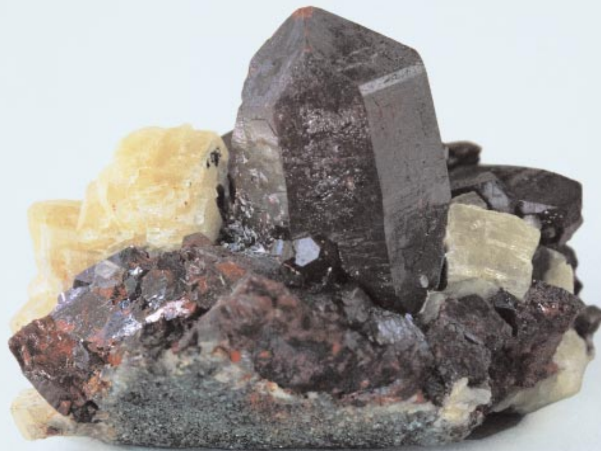
Cinabro. Il minerale viene polverizzato e lavorato in compresse, impiegate per i catarri acuti e cronici delle vie respiratorie.

Così, per esempio, le sostanze amare estratte dalla radice della genziana gialla oppure dalla cicoria, possono favorire la secrezione dei succhi gastrici e stimolare la motilità gastro-intestinale. Gli oli essenziali delle labiate, come il rosmarino e la lavanda, con il loro calore peculiare possono favorire l'irrorazione sanguigna e sciogliere le contrazioni muscolari. Inoltre vengono utilizzati rimedi particolarmente appropriati per una specifica malattia e la cui composizione si orienta alle leggi generali del quadro clinico. Si tratta di preparati ottenuti da estratti vegetali completi e di preparati di origine minerale o animale.