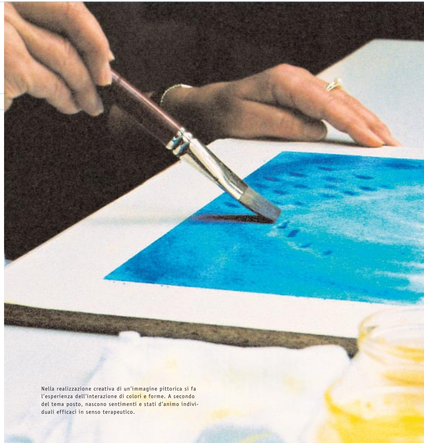
Nella realizzazione creativa di un'immagine pittorica si fa l'esperienza dell'interazione di colori e forme. A secondo del tema posto, nascono sentimenti e stati d'animo individuali efficaci in senso terapeutico.

Il concetto „antroposofia“ è composto dalle parole greche „anthropos“ (uomo) e „sophia“ (saggezza). Questo significa: l'uomo che conosce se stesso è al centro – anche nella medicina. Già nel 1921 nacquero, ad Arlesheim nei pressi di Basilea (Svizzera) e a Stoccarda (Germania), i primi istituti clinici, allora ancora molto semplici, in cui venne