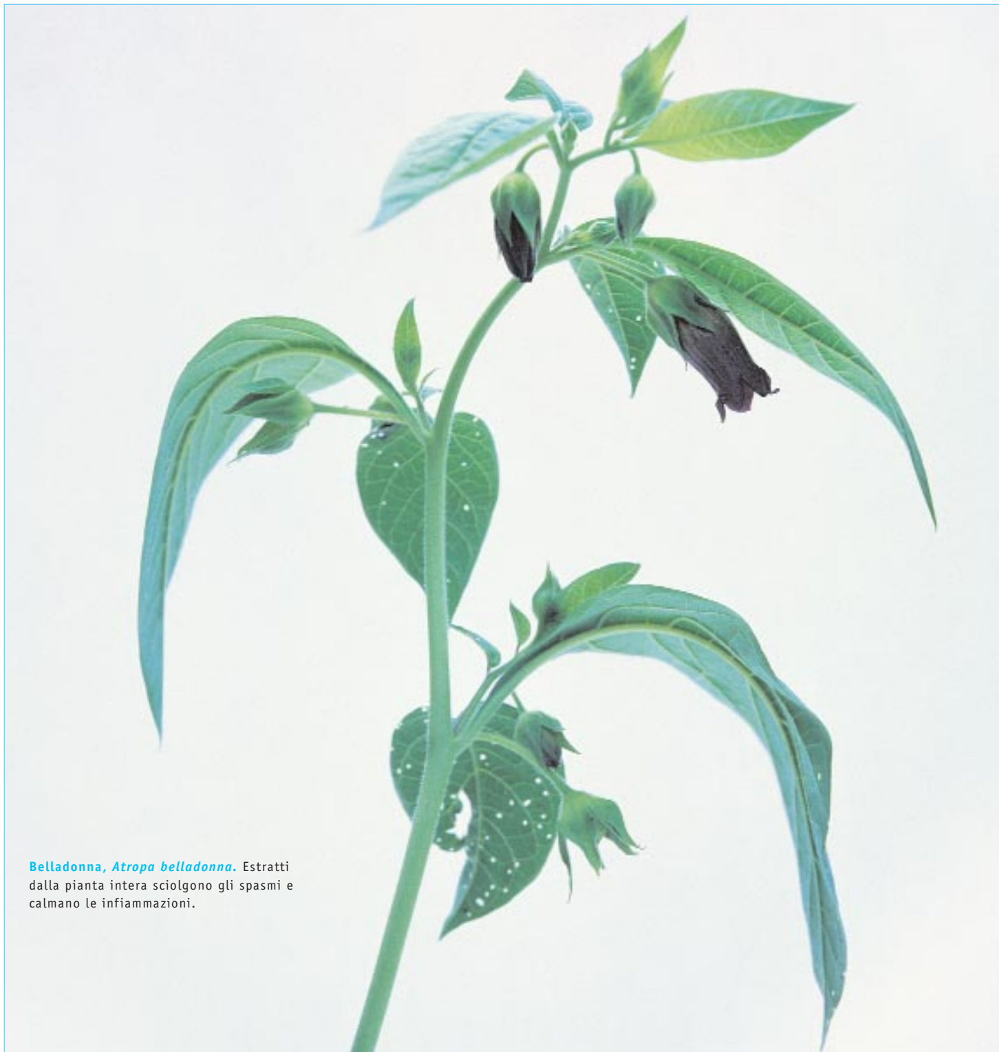
Belladonna, Atropa belladonna . Estratti dalla pianta intera sciolgono gli spasmi e calmano le infiammazioni.