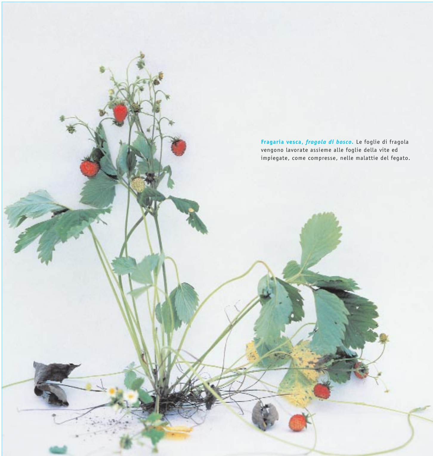
Fragaria vesca, fragola di bosco. Le foglie di fragola vengono lavorate assieme alle foglie della vite ed impiegate, come compresse, nelle malattie del fegato.