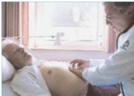
Gli esiti ottenuti dalla palpazione dell'addome (a sinistra) vengono analizzati e completati tramite un controllo con ultrasuoni (a destra).